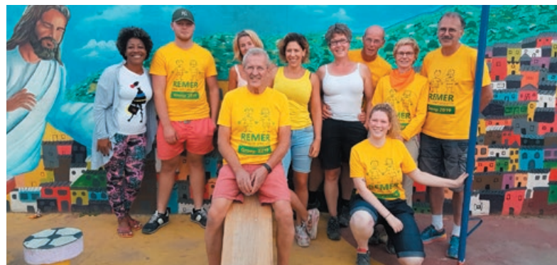
Laatste groep van 2019.